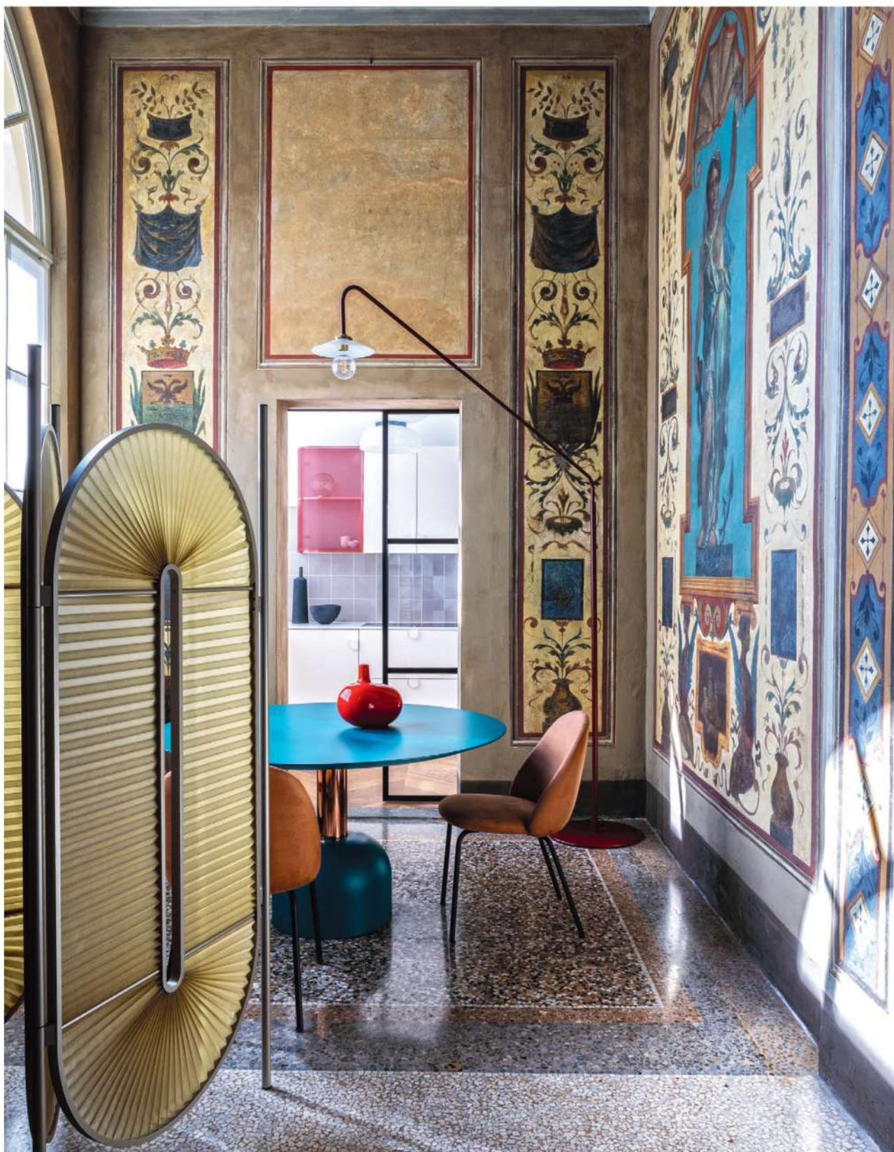
KĄCIK ŚNIADANIOWY ukryty za parawanem Minima Moralia z plisowanej tkaniny (proj. Christophe de la Fontaine). Nad okrągłym stołem Illo i krzesłami lolaa (wszystko od Miniforms) unosi się lampa z galerii Valerie Objects'. Minimalistyczne meble kolorystyką i formą idealnie współgrają z bogatą dekoracją ścian. W tle, za szklanymi drzwiami widać fragment kuchni.