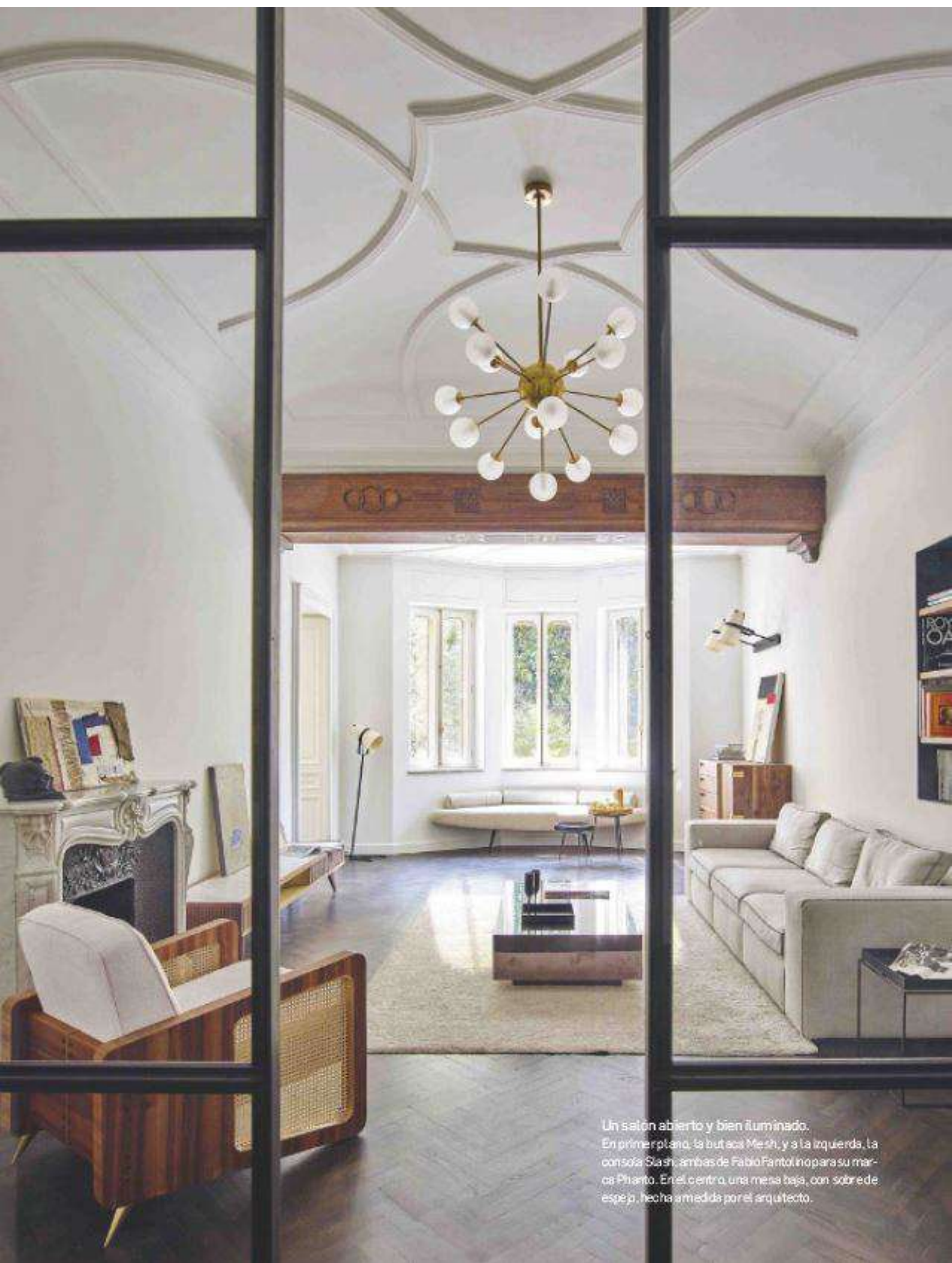
Un salón abierto y bien iluminado. En primer plano, la butaca Meshi, y a la izquierda, la consoleta Slash, ambas de Fabio Piantoni para su marca Piantoni. En el centro, una mesa baja, con sobre de espejo, hecha a medida por el arquitecto.